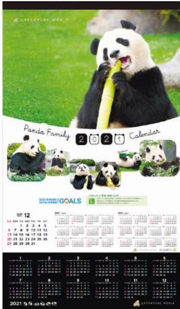
パンダファミリー